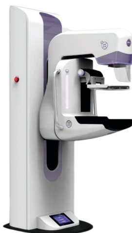
Máy chụp X quang

Chụp X quang tuyến vú là xét nghiệm tốt nhất hiện có, nhưng cũng giống như các xét nghiệm y tế khác, chúng có thể bỏ sót một số khối ung thư rất nhỏ.